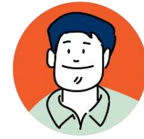
• หน่วยกำกับฯ

แอดมินสถานศึกษาติดตามการทำงาน ของครู / ดึงข้อมูลสรุปภาพรวมของ รร เสนอผู้อำนวยการสถานศึกษา