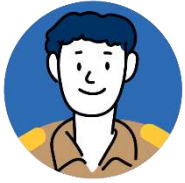
• ครูประจำชั้น

ครูประจำชั้น / ครูคัดกรอง สํารวจ และบันทึกข้อมูลการศึกษาต่อของ นักเรียน