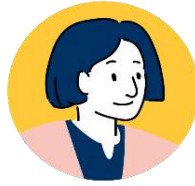
• ครูแอดมิน

ครูประจำชั้น / ครูคัดกรอง สํารวจ และบันทึกข้อมูลการศึกษาต่อของ นักเรียน